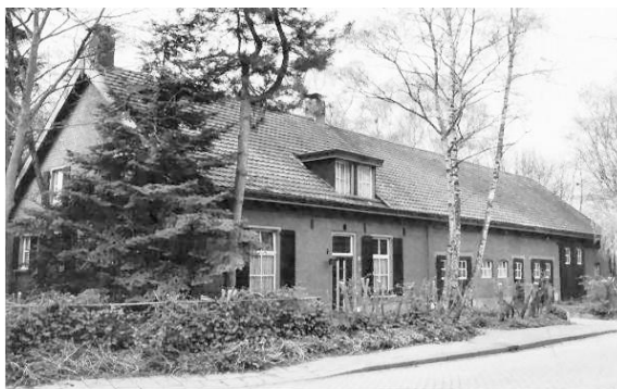
Hekelstraat nr. 19